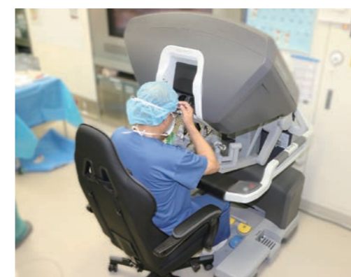
サージョンコンソール

の尿失禁が問題になる手術でした。また、前立腺の周囲は血流が豊富であることから比較的出血が多い手術でした。ロボット支援根治的前立腺摘除術が他の疾患の手術に先駆けていち早く保険適応となりました理由がここにあります。つまり、欧米で開始されたロボット支援手術では、従来の手術に比べて出血量が少なく、術後の尿禁制の回復も早いことがわかりました。その上、がんの制御でも従来の手術より優れている事が報告されました。本邦でも保険適応となつて数年間のデータで、従来の手術に比べてがんの治療においても、手術時の出血量の点でも、術後の尿禁制の面でも優れていることが証明されました。当院では2018年以降、前立腺がんに対する根治術を希望される方には患者さんのメリットを考え、旭川での施設を紹介することとしてきました。当院でロボット